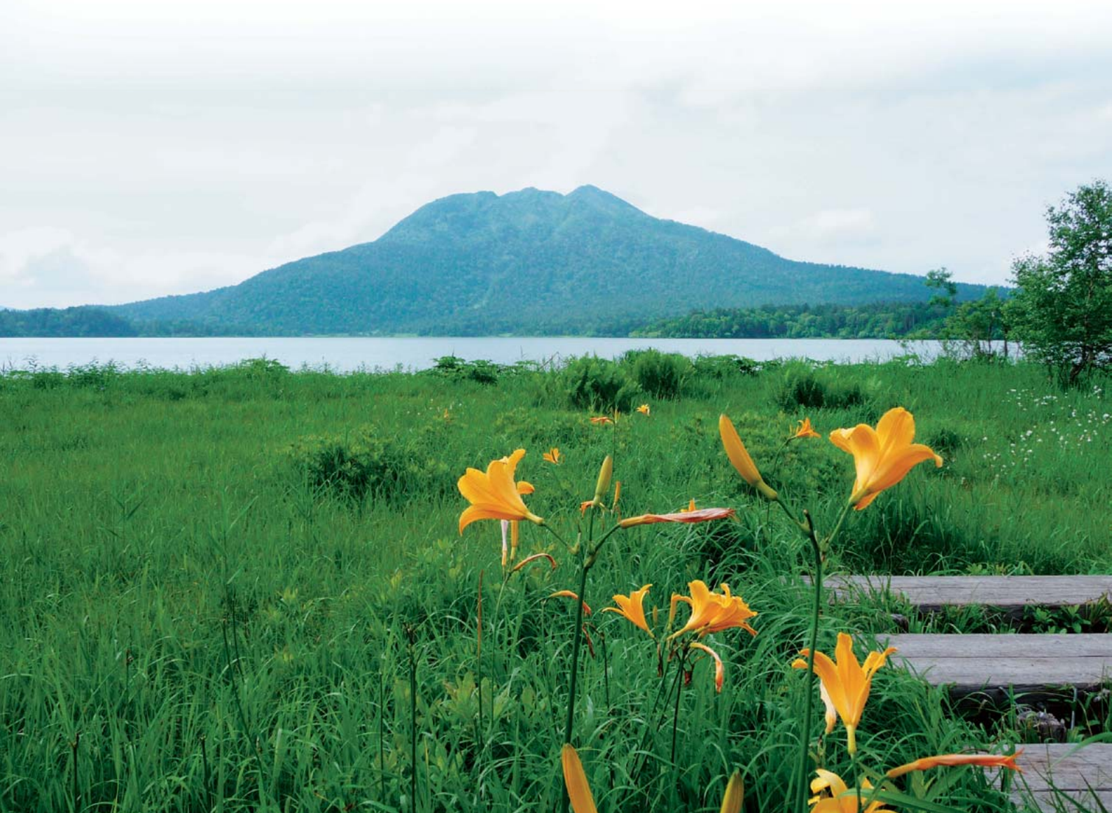
尾瀬沼と燧ヶ岳（ひうちがたけ）