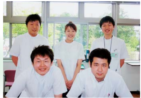
当院の理学療法士

これらを用い、患者さまの残存能力・存在能力を引き出せるようにリハビリを行っています。また、必要に応じて患者さまの自宅に伺い、住宅の評価を行って改修やご自宅で安心して過ごすための注意点などの助言も行います。